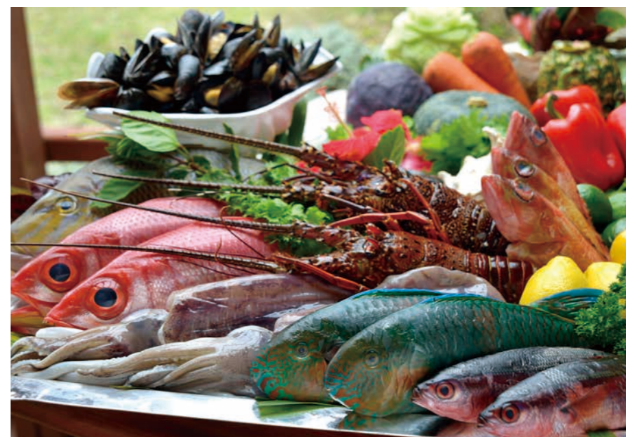
新鮮な魚介類が並ぶディスプレイコーナーから食材を選ぶ楽しさを満喫